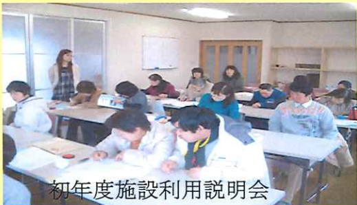
初年度施設利用説明会