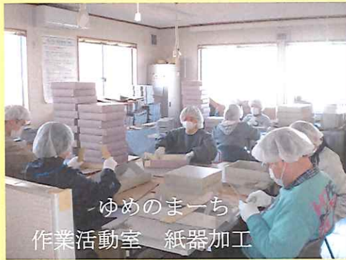
ゆめのまーち 作業活動室 紙器加工