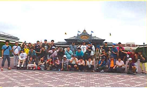
初秋の一泊旅行 東京ディズニーランド