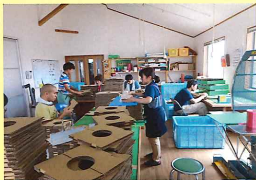
作業活動室段ボール加工