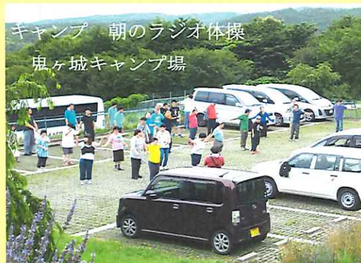
キャンプ 朝のラジオ体操 鬼ヶ城キャンプ場